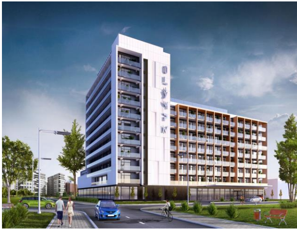
Hotel Olymp IV